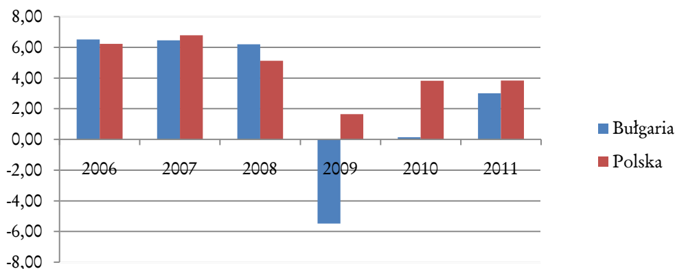
Wykres 1. Dynamika PKB (proc.)