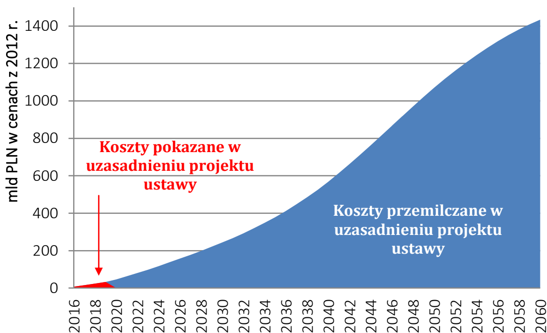
Wykres 2. Skumulowane koszty powrotu do dawnego systemu emerytalnego dla finansów publicznych (ceny stałe)